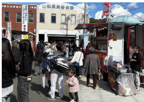
キッチンカー とても賑わっていました！