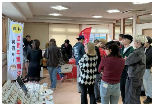
住友生命さんの 血管年齢測定他