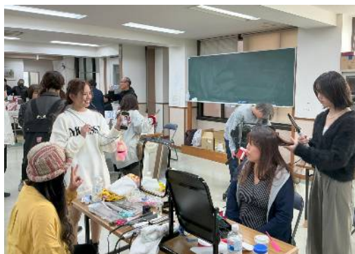
組合員(美容師)による ヘアアレンジ