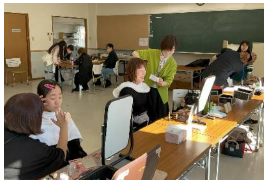
組合員(美容師)による ポイントメイク