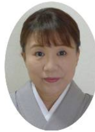
山梨卓越技能者 「やまなしの名工」 受賞に際して