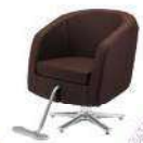
LUPINA ルピナ ¥118,000(税別)