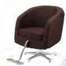
LUPINA ルピナ ¥118,000(税別)